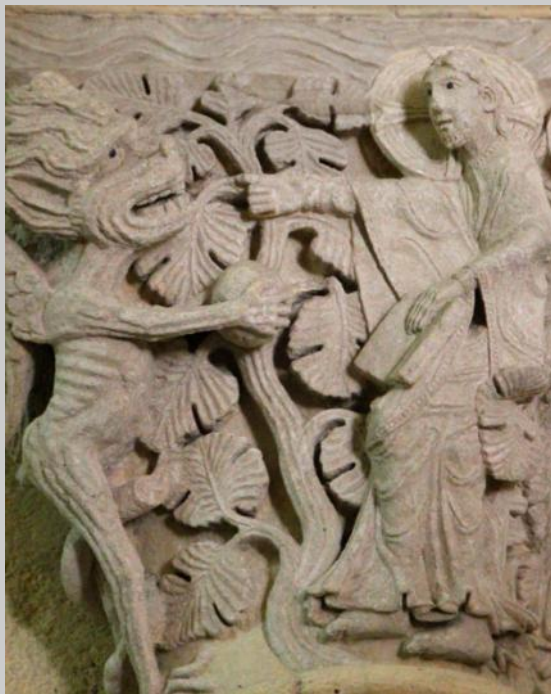
La tentation du Christ au désert, église Saint-Andoche, Saulieu (France), v. 1150

Que ce temps du Carême, temps de prière, de pénitence et de générosité envers le prochain, soit pour nous un temps « d'entraînement spirituel » : comme soldats du Christ, faisons de ces quarante jours un entraînement pour le combat spirituel et demandons à Dieu qu'il ne nous laisse jamais succomber à la tentation mais qu'il nous délivre du mal.